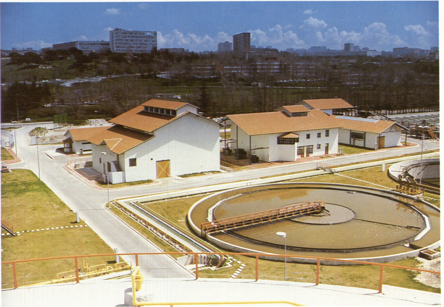
Arriba, vista de la intervención. Abajo, detalle de fachada.